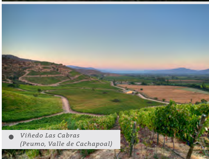
● Viñedo Las Cabras (Peumo, Valle de Cachapoal)