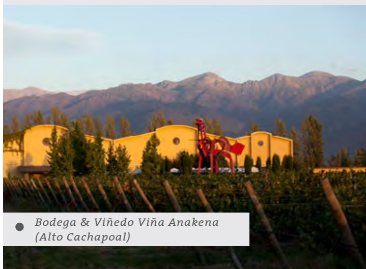
● Bodega & Viñedo Viña Anakena (Alto Cachapoal)

Anakena revela sus orígenes: La fuente de nuestros vinos de alta calidad. Cuatro viñedos ubicados en los mejores terroirs de Chile, desde donde elaboramos nuestros vinos finos.