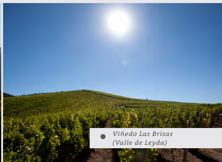
● Viñedo Las Brisas (Valle de Leyda)