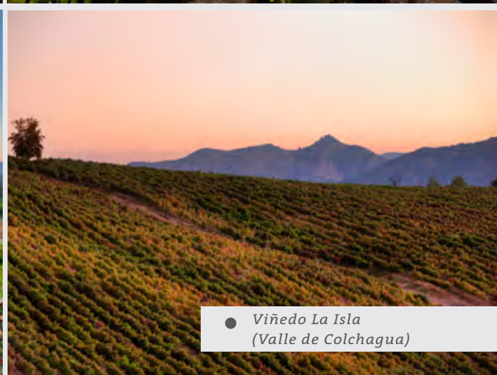
● Viñedo La Isla (Valle de Colchagua)